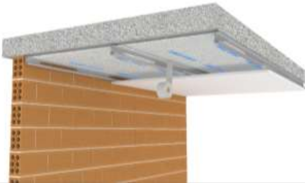
Figura 7.2: Instalación sobre falso techo con una cámara de aire realizada con los rastreles de soporte del falso techo.