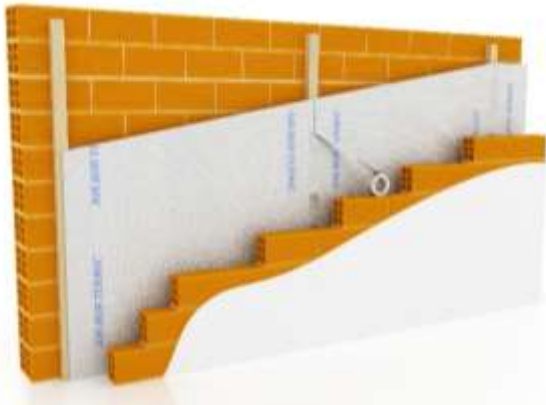
Figura 7.1: Instalación en paredes sobre rastreles de madera.