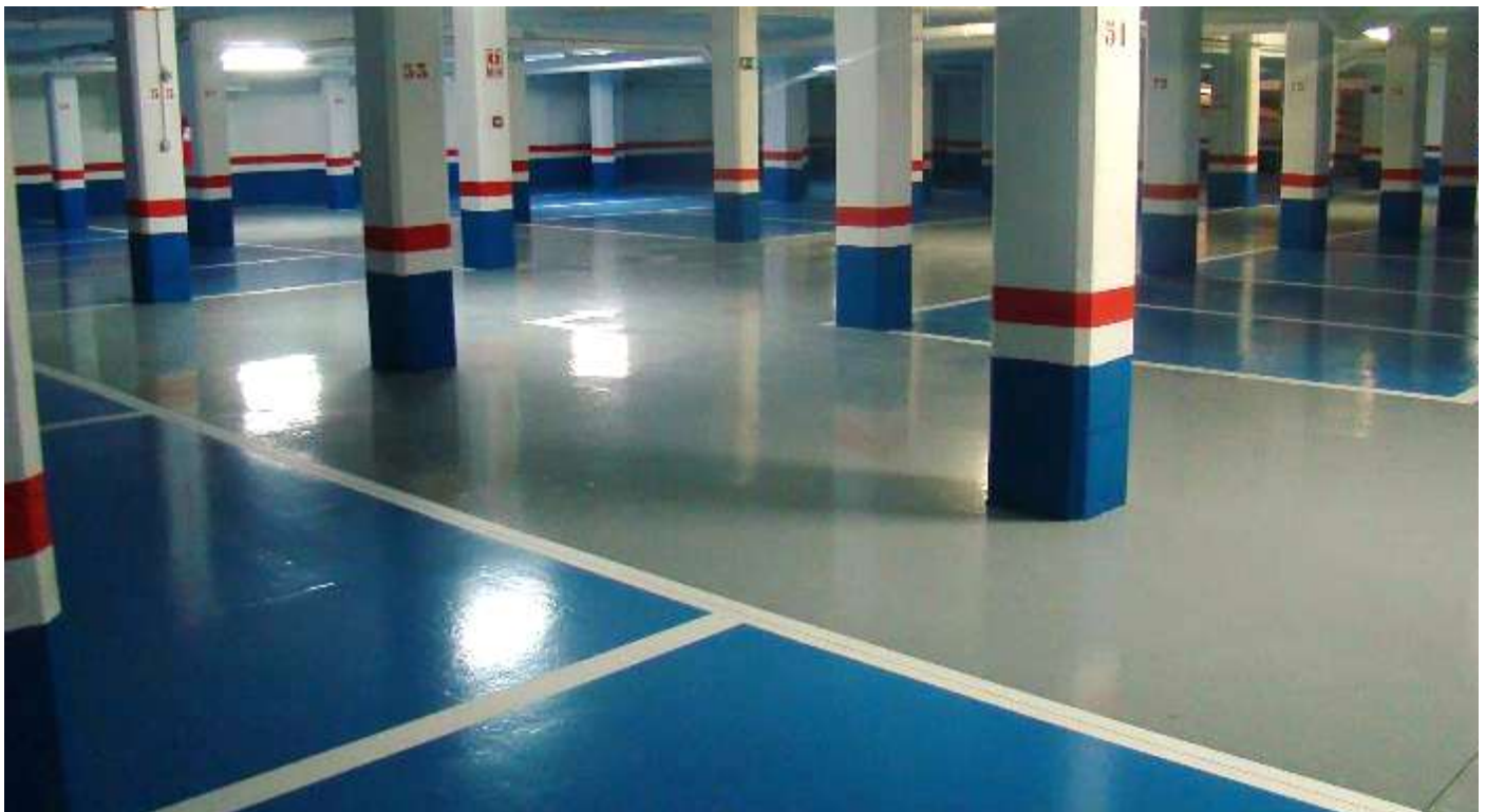
Figura 5.3: Ejemplo de sistema terminado en parking.

Los residuos generados durante la puesta en obra deberán ser gestionados según la legislación vigente por un gestor autorizado a tal efecto (véase el Real Decreto 105/2008, de 1 de febrero, por el que se regula la producción y gestión de los residuos de construcción y demolición).