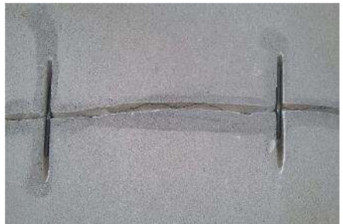
Figura 5.1: Instalación de varillas para el tratamiento de fisuras de gran espesor previas del soporte.