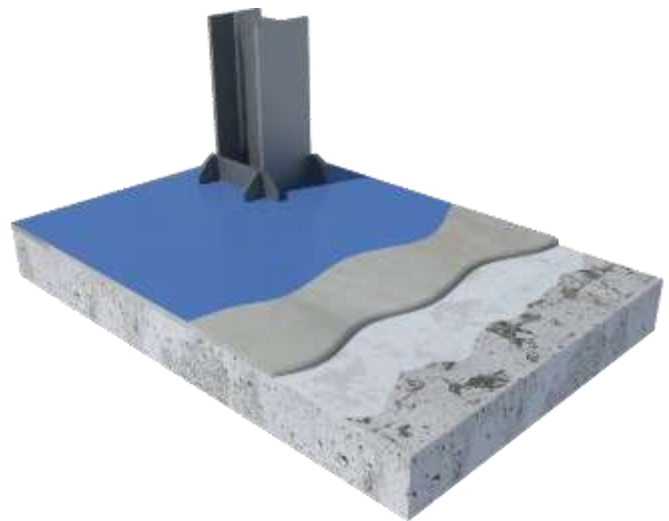
Figura 1.1: Representación esquemática del sistema de pavimentación.