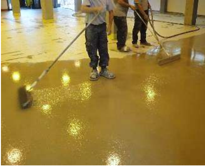
Figura 5.2: Vertido y tratamiento del mortero polimérico autonivelante.