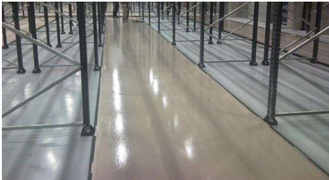
Figura 5.4: Ejemplo de sistema terminado en industria con requisitos de alta planimetría.

Los aspectos relevantes destacados en el transcurso de la realización de las visitas de obra se han incorporado a los criterios de proyecto y ejecución indicados en los capítulos 4 y 5.